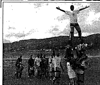
Alcune immagini degli artisti di Nairobi

Amani", uno spettacolo di acrobazia e giocoleria, entusiasmante e coinvolgente, che sarà presentato in diverse città d'Italia con prima tappa a Bari. L'esibizione è stata accompagnata da musica eseguita dal vivo da una giovane orchestra di musicisti con tamburi e percussioni. "Il nostro fine - hanno spiegato gli organizzatori - è quello di presentare uno spettacolo originale e